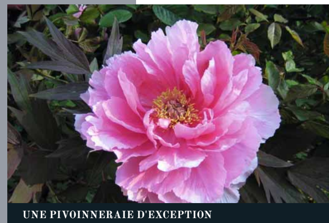
UNE PIVOINNERAIE D'EXCEPTION

Cette résidence hôtelière de charme renferme encore d'autres bijoux comme la superbe salle de petit-déjeuner de style XVIII e siècle suédois, tout en blanc et or avec ciel à la Tiepolo... Pour un petit déjeuner gourmand ou transformée en salle de concert le temps d'un festival, elle suscite bien des regards admirateurs.