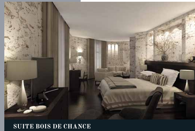
SUITE BOIS DE CHANCE