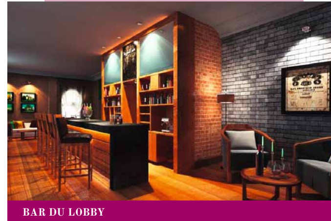
BAR DU LOBBY

Si l'extérieur a conservé son cachet d'Art Nouveau avec sa frise classée Intérêt culturel architectural, l'intérieur affiche un style chic et épuré. Mélange d'élégance et de raffinement, les matériaux nobles, briques artisanales, planchers de bois de chêne, cheminée dans le lobby, s'accordent à merveille et nous transportent dans différents univers.