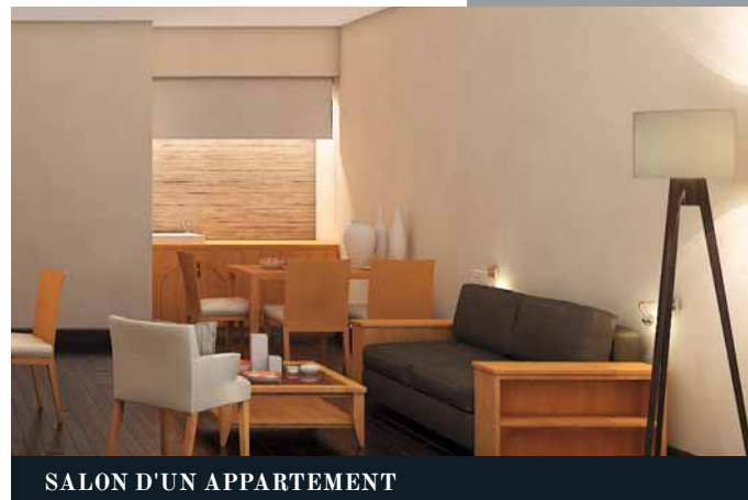
SALON D'UN APPARTEMENT

Une reconnaissance due aux matériaux utilisés, mais aussi à l'envie de consommer autrement, en respectant l'environnement (ampoules basse tension, économiseur d'eau, jardins traités sans phyto-chimie). Et des actions au quotidien grâce à la sensibilisation des équipes et du personnel. L'hôtel s'engage en effet au tri sélectif, à être moins gourmand en linge, accessoires jetables etc. Un projet de poulailler permettant d'absorber un certains nombres de déchets organiques devrait même voir le jour pour le plaisir des enfants.