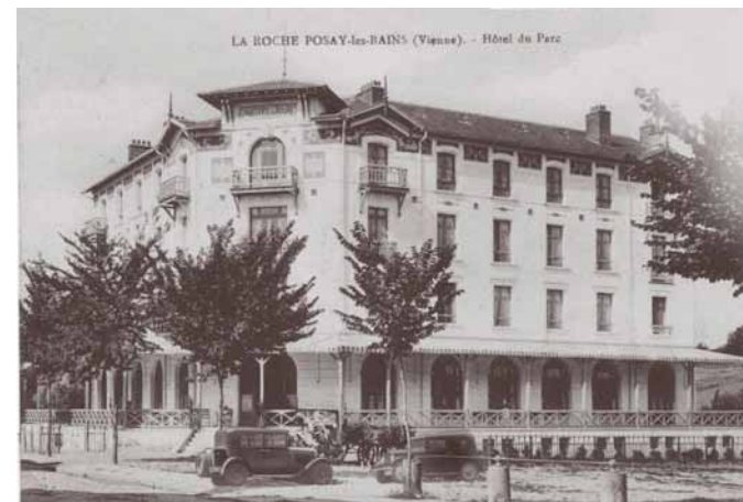
La Roche-Posay, février 2015

Construit en 1905, dans le plus pur style « Grand Hotel », j'ai longtemps conservé l'âme qui a fait ma renommée dans les années 30. C'est en effet durant la « belle époque », que j'accueille de nombreuses personnalités du monde artistique et intellectuel, venant à La Roche-Posay pour y « prendre les eaux » et savourer le calme et l'élégance de ce coin privilégié de nature.